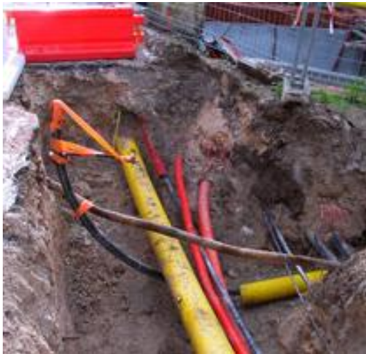
Travaux réellement réalisés

Il représente la localisation des ouvrages en classe A .