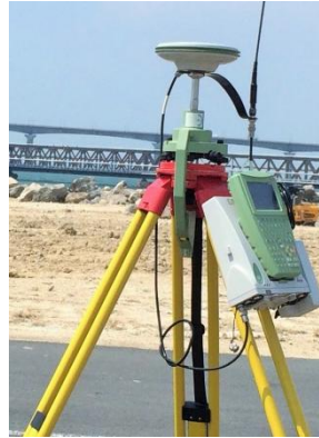
Station mobile robotisée (G.P.S)