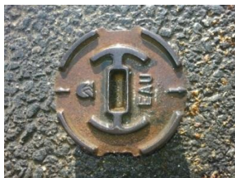
Bouche à clef