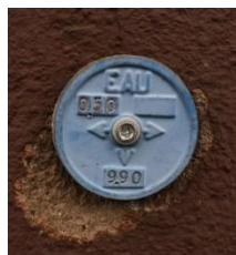
Plaque de façade Indiquant la position de la bouche à clé