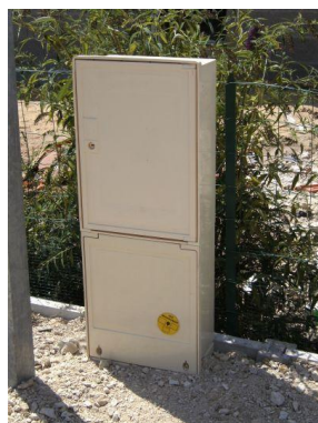
Borne Electrique ou Gaz