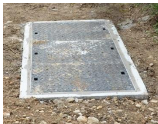
Chambre télécom/vidéo Fibre